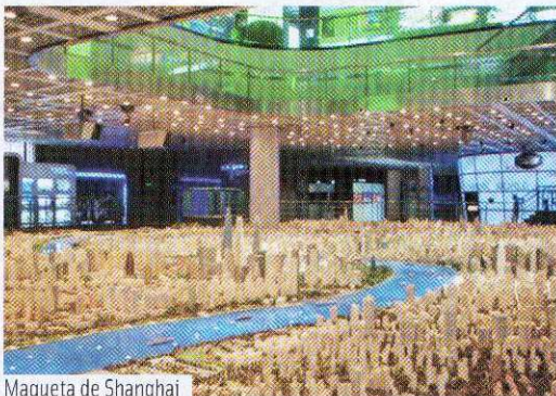
Maqueta de Shanghai