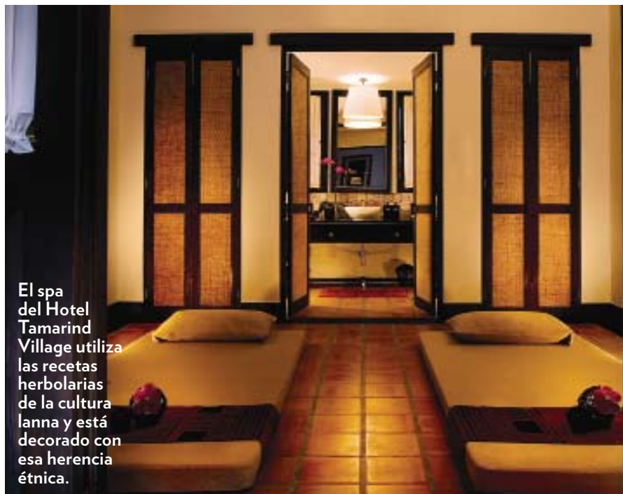
El spa del Hotel Tamarind Village utiliza las recetas herbolarias de la cultura lanna y está decorado con esa herencia étnica.