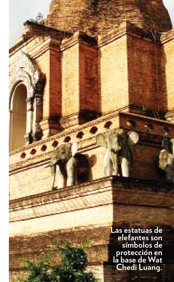
Las estatuas de elefantes son símbolos de protección en la base de Wat Chedi Luang.

Por la noche, los restaurantes a la orilla del río, como The Riverside, ofrecen una deliciosa y romántica experiencia culinaria. Para una salida elegante y sorprendentemente accesible, el Grand Lanna, dentro del Mandarin Oriental Dhara Devi, tiene un menú ▶